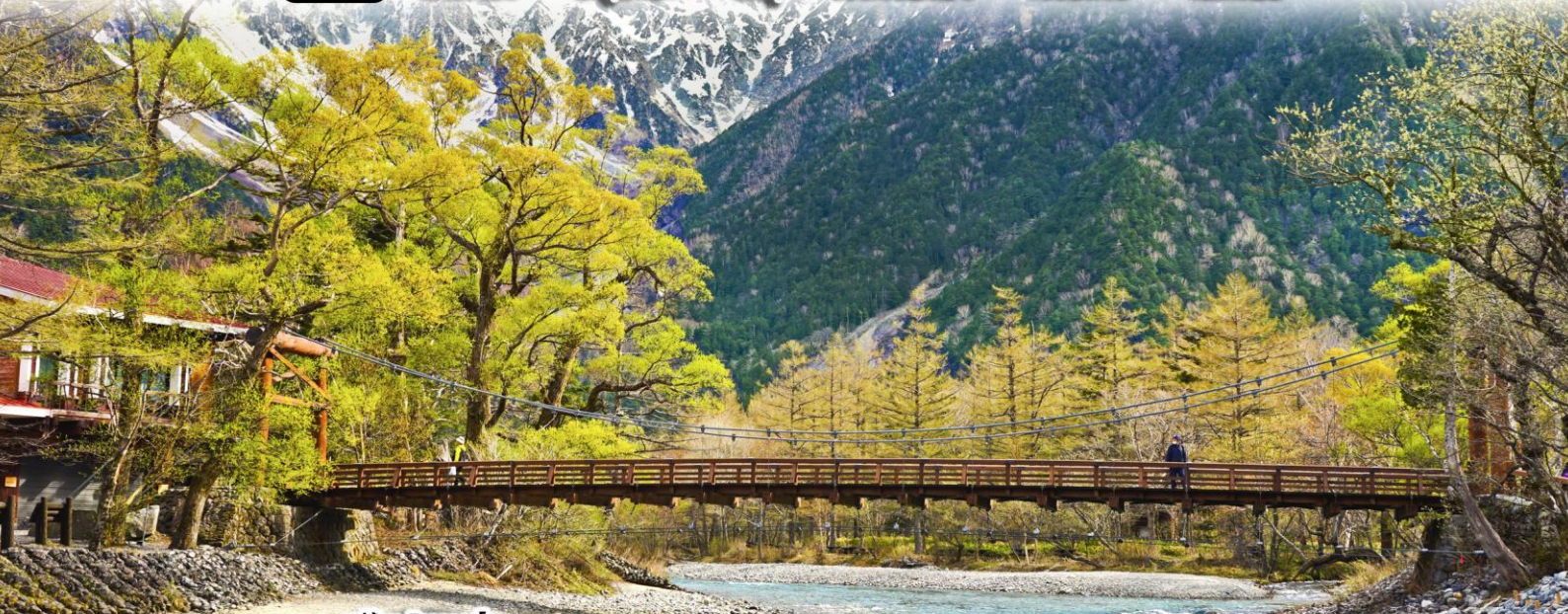
หมู่บ้าน ชิราคาวาโกะ

J05_7 นาโกย่า - อินูยามะ - ทิฟู - ทาคายาม่า - คามิโคจิ - โตเกียว