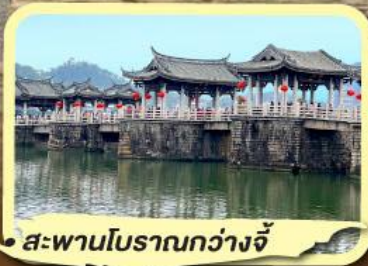
• สะพานโบราณกว่างจี