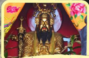
• เอียงบู๊ซิว (ศาลเจ้าพ่อเสือ)