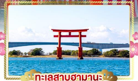
ทะเลสาบฮามานะ