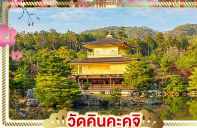
วัดคินคะคุจิ