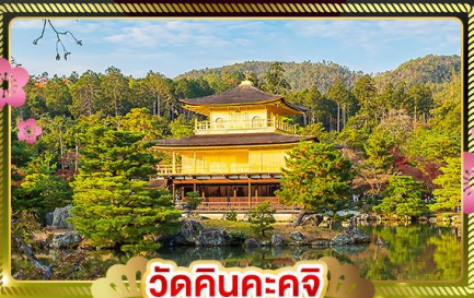
วัดคินคะคุจิ

นั่งรถไฟความเร็วสูง NAGOYA - MIKAWA ANJO