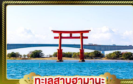
ทะเลสาบฮามานะ