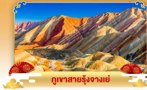
ภูเขาสายรุ้งจางเย่