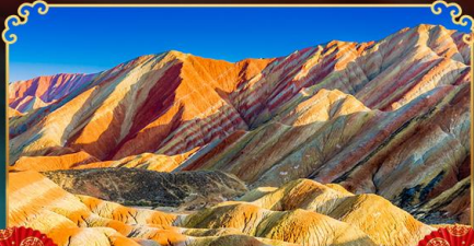
ภูเขาสายรุ้งจางเย่

เดินทางตามรอยเส้นทางสายประวัติศาสตร์โลก ชมโอเอซิสกลางทะเลทราย "ทะเลสาบพระจันทร์เสี้ยว"