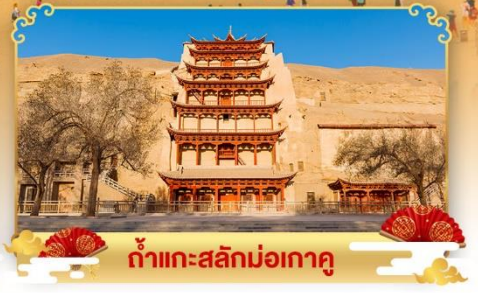
กำแพงสลักม่อเถาคุ

เดินทางโดย : สายการบินโซนาอิสรินแอร์ไลน์ & เซี่ยงไฮ้แอร์ไลน์