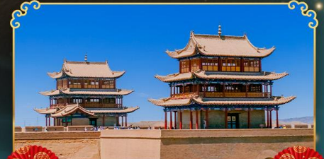
กำแพงเมืองจีนเจียวอี่กวง