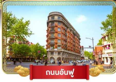
ถนนอันฟู