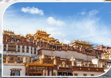
วัดชงจัวหลิง แชงกรีล่า