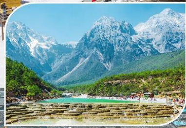
หุบเขาสีน้ำเงิน ไป๋ซุยเหอ