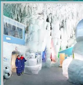
"KAMIKAWA ICE PAVILLION"