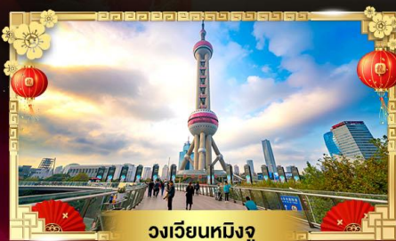
วงเวียนทมิ้งจู