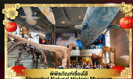
พิพิธภัณฑ์เซี่ยงไฮ้ Shanghai Natural History Museum