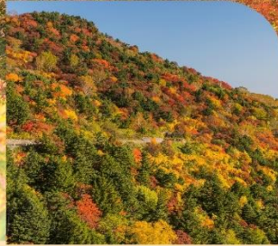
บันได อะซุมะ สกายไลน์