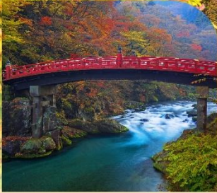
สะพานชินเคียว