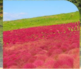
อิตางิ ชิโซนิ ปาร์ค