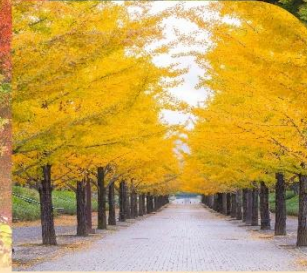
อุโมงค์ใบแปะปทวย อะซุมะ