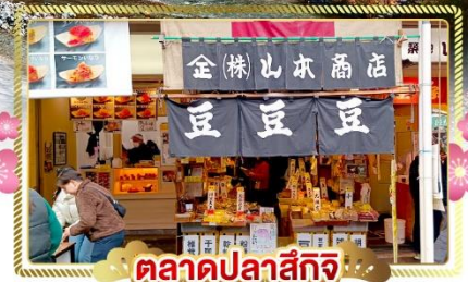
ตลาดปลาสึกิจิ