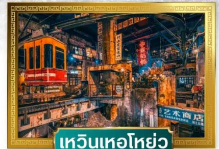
เหวินเหอโฮ่ย