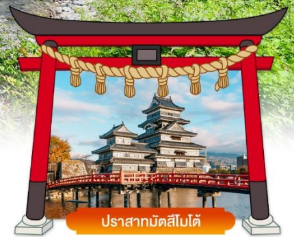
ปราสาทมัตสึโมโต้