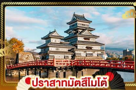
ปราสาทมัตสึโมโด้